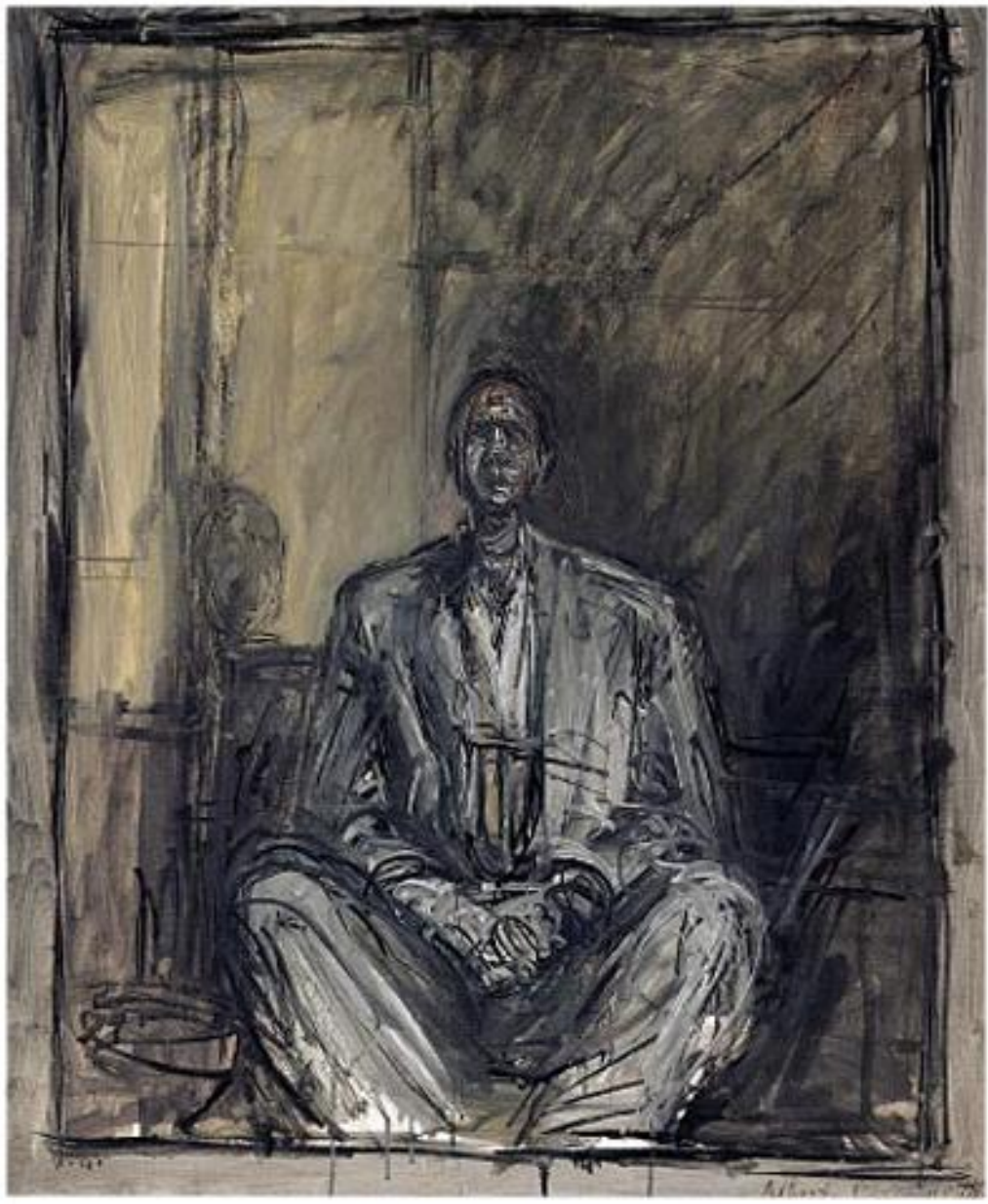
Jean Genet par Giacometti